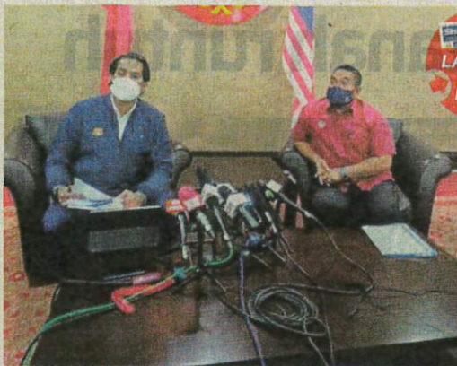
Khairy (kiri) bersama Muhammad Sanusi pada sidang akhbar selepas lawatan kerja dan mesyuarat Pasukan Petugas Khas Imunisasi Covid-19 (CITF) di Wisma Darul Aman, Alor Setar pada Ahad.

"Kumpulan ini kita akan dahulukan sebelum membukanya kepada golongan lain," katanya kepada pemberita selepas lawatan kerja dan mesyuarat Pasukan Petugas Khas Imunisasi