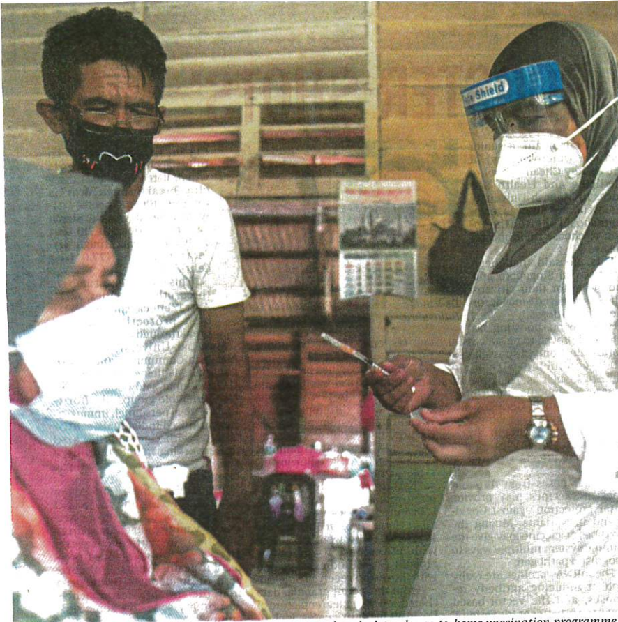
A senior citizen getting a dose of the Covid-19 vaccine during a home-to-home vaccination programme in Kuantan, Pahang, yesterday.