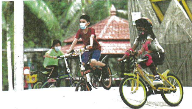
Children cycling while wearing face masks at the Perdana Botanical Garden in Kuala Lumpur yesterday.