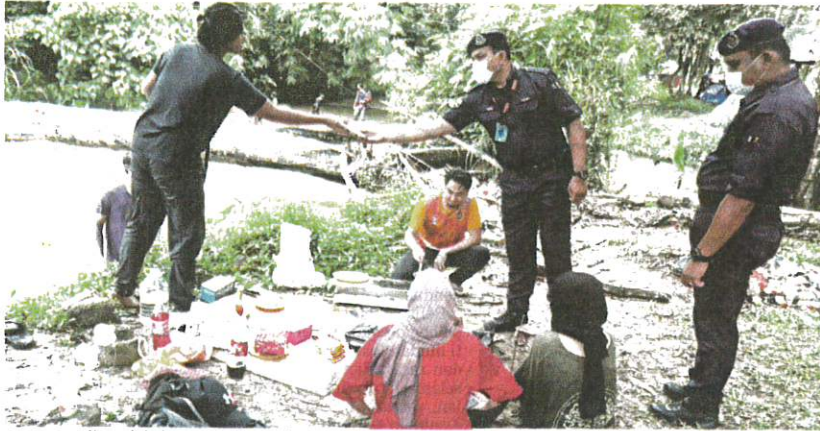
Anggota polis melakukan pemeriksaan dan pemantauan pematuan SOP pengunjung di kawasan Taman Rimba Kancing, Rawang, semalam.