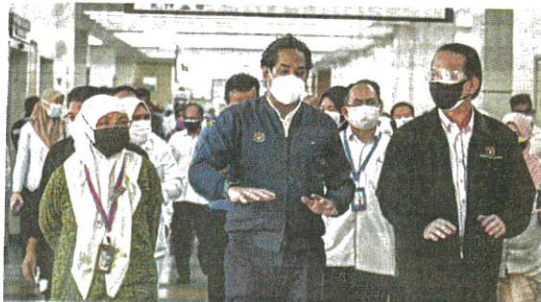
Health Minister Khairy Jamaluddin (centre) talking with Health director-general Tan Sri Dr Noor Hisham Abdullah during a visit to Sultanah Bahiyah Hospital in Alor Star yesterday.

He said details of the package would be announced by the health minister.